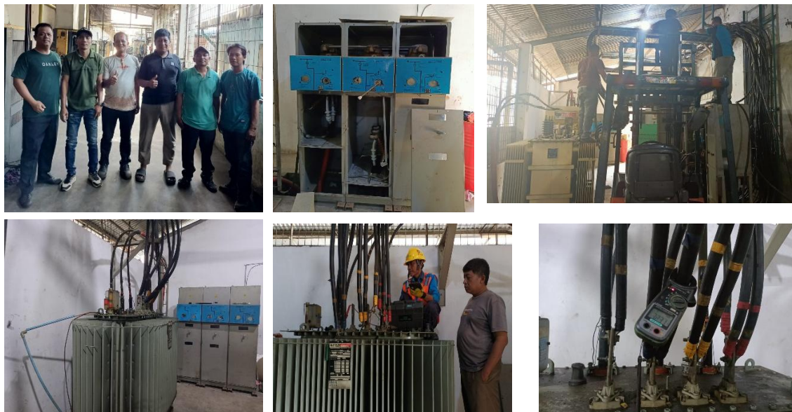
Gambar 2. Pelaksanaan Kegiatan Pelatihan Perawatan Transformator Daya

Secara keseluruhan, hasil dan pembahasan ini menunjukkan bahwa pelaksanaan pelatihan pemeliharaan transformator daya berbasis evaluasi pre-test dan post-test dapat menjadi model pengabdian masyarakat yang efektif untuk meningkatkan keandalan sistem kelistrikan industri serta meminimalkan potensi gangguan dan risiko kecelakaan kerja.