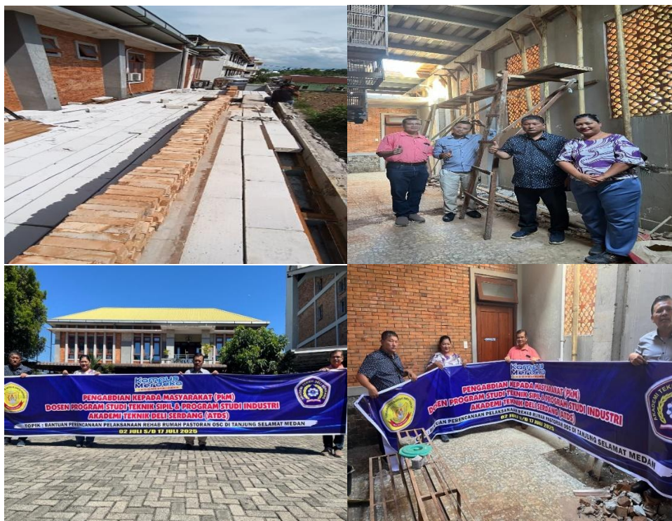
Gambar 3. Pelaksanaan Pembangunan & Kegiatan PkM di Gereja Katolik Salib Suci Kuasi Tj. Anom

Metode pelaksanaan renovasi yang diterapkan berorientasi pada efektivitas dalam pencapaian target yang telah ditetapkan. Hal ini mencakup ketepatan dalam pemilihan bahan yang digunakan, penentuan tenaga kerja yang kompeten, serta ketepatan waktu pelaksanaan. Dengan demikian, anggaran yang tersedia dapat dimanfaatkan secara optimal dan menghasilkan kualitas renovasi yang baik.